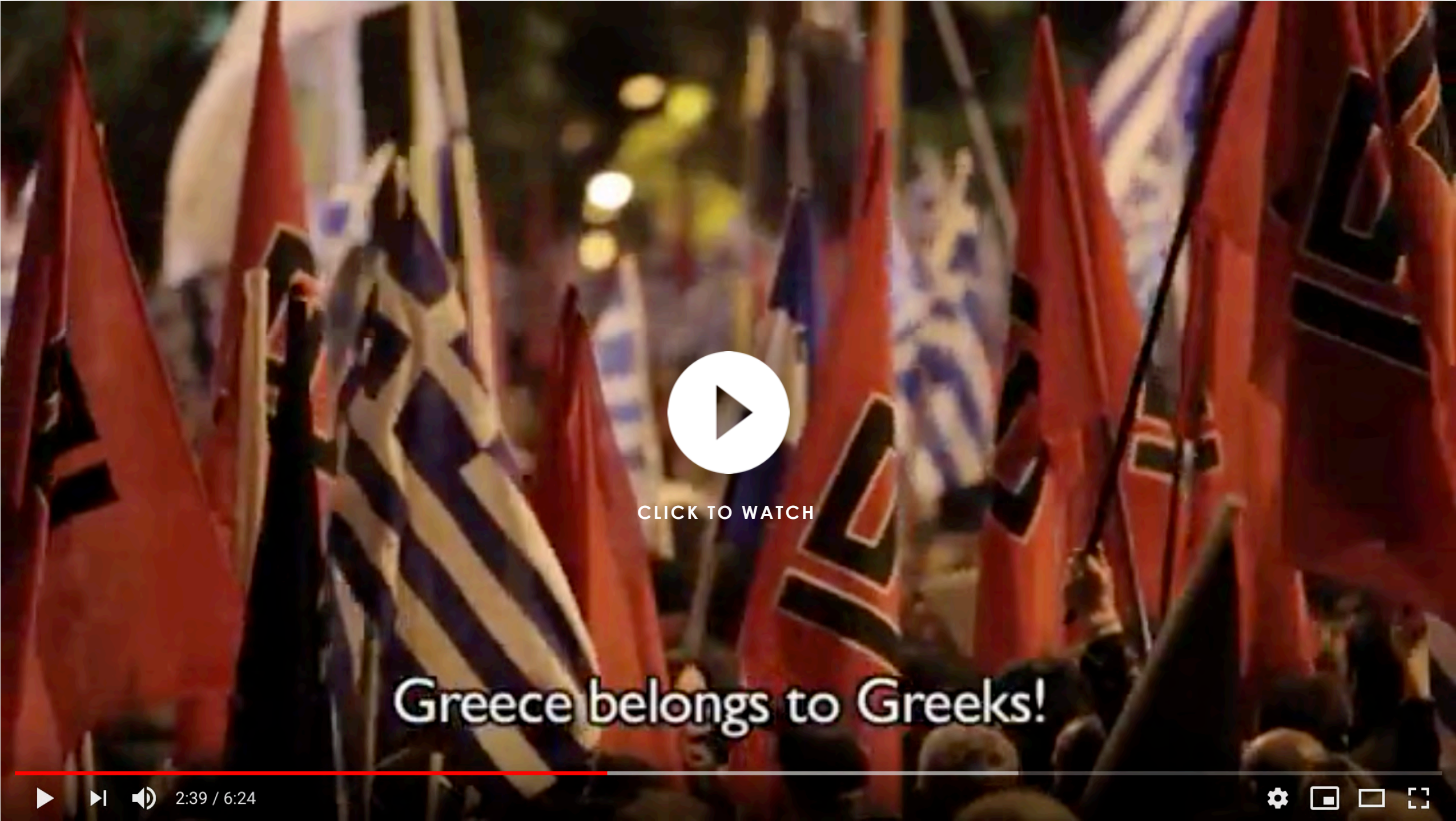
Neo Nazi tattoos fall out of fashion in Greece after Golden Dawn crackdown